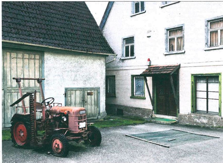
De Duitse fotograaf Claudio Hills fotografeerde krimpgebieden in zijn geboorteland.