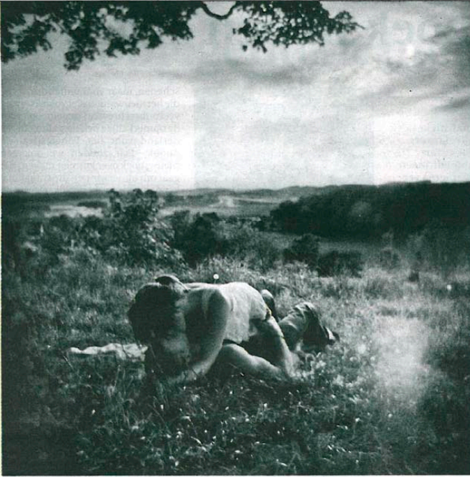
Lowlands van Martin Bogren.

De Veenkoloniën in oostelijk Groningen en Drenthe worden gekenmerkt door lange, handgegraven kanalen, waarover met schuiten turf werd afgevoerd. De gravers van de kanalen kenden een eigen hiërarchie. De man die onderin stond op de bodem van het kanaal stond het laagste in aanzien en verdiende het minst. De middelste man iets meer en de man die boven aan de wal stond had het meeste aanzien en verdiende dienovereenkomstig. Uit de wereld van het kanalen graven komt dan ook de term 'hogerop komen'.